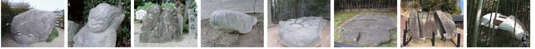
가메이시 석 사루이시 석 니멘세키 석 마라이시 석 사카후네이시 유적 오니노마나이하도마 오니노 셋칭 측간 마스다노이와후네 석