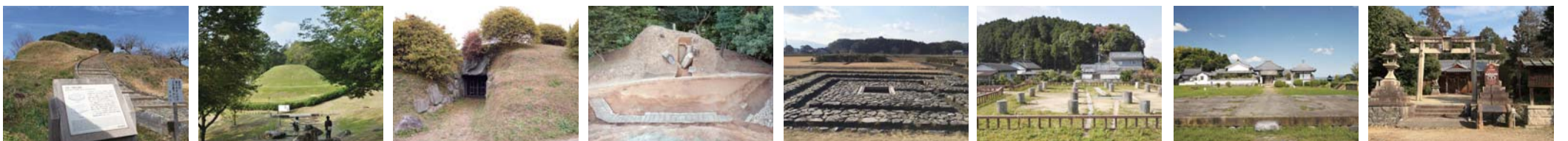
텐무/지토 천황능 다카마쯔즈카 고분 미야코즈카 고분 켄고시즈카 고분 아스카 쿠후세키·궁적 아스카 미즈오치 유적 가와하라 데라야도 사적 히노구마데라야도 사적 (오미야시 진사신사)