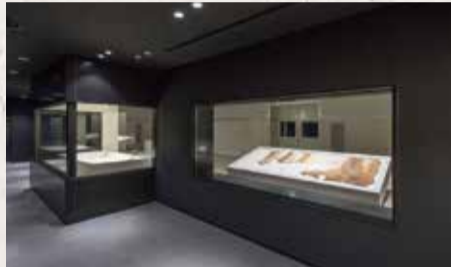
●可以在参观通道上通过玻璃幕墙观赏壁画。

在四神之馆1层，定期展示为便于保存而从石室中取出来的Kitora古坟壁画的实物。