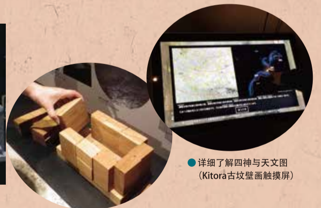
●详细了解四神与天文图(Kitora古坟壁画触摸屏)