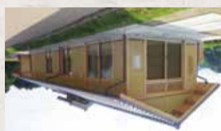
기토라강 기토라강변에 위치한 기토라강변역사박물관은 기토라 고분 주변 지구의 역사를 소개하고 있습니다.

기토라강은 기토라 고분 주변 지구를 흐르는 아름다운 강입니다. 강변에는 많은 나무와 꽃이 피어 봄과 가을에 아름다운 경관을 연출합니다. 강변에는 산책로와 자전거 도로가 조성되어 있어 가족 단위로 즐기기에 좋습니다.