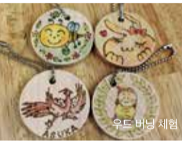
우드 버닝 체험