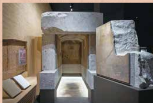
● 原尺寸大小的石室（Kitora古墳石室模型）