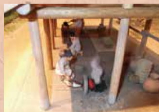
● 立體重現古代飛鳥人的生活（立體透視模型）