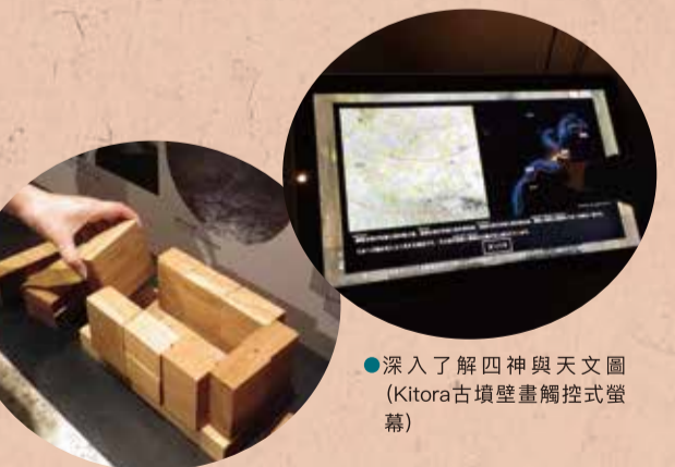
● 深入了解四神與天文圖（Kitora古墳壁畫觸控式螢幕）