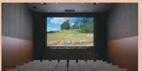
● 欣賞以Kitora古墳與飛鳥為主題的影片（劇場）