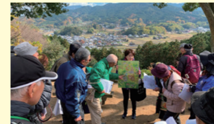
飛鳥の史跡を案内