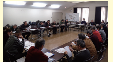
飛鳥里山クラブの方針を決める会議