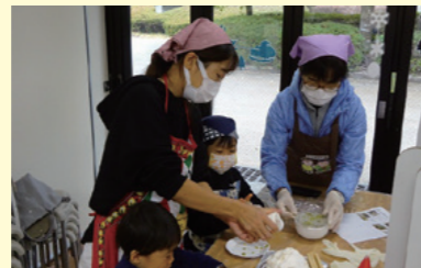
イベントで子供たちとふれあう

国営飛鳥歴史公園の魅力を発信するため、公園イベントへの協力や運営補助、甘樫丘での里山保全活動、公園利用サービス、これらを行って行くための組織運営を会員みんなで協力して行っています。