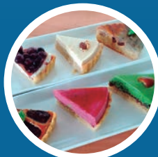
もりや工房 (ヴィーガンスイーツ)