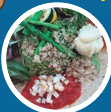
CAFÉ-NeKKO (大和野菜のヴィーガンプレート)