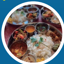
スパイス精進モハマヤバード (純菜食のインド料理)