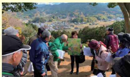
飛鳥の史跡を案内