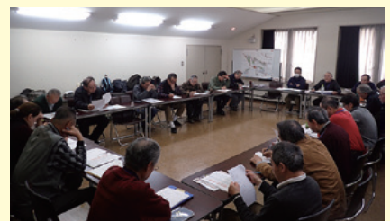
飛鳥里山クラブの方針を決める会議