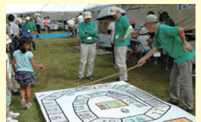
イベントで子供たちとふれあう