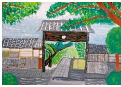
第29回小学3.4年生の部 金賞