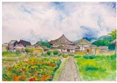
第29回中・高生の部 金賞