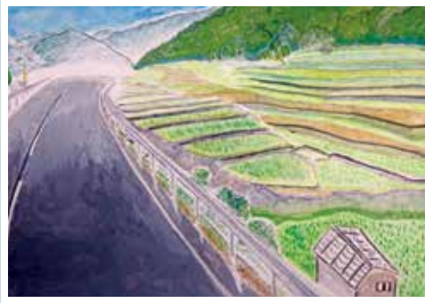
第29回小学5.6年生の部 金賞