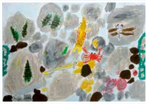
第29回幼児の部 金賞