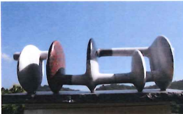
2017 "The Belt and Road" 2017 Qingdao Invitation Sculpture Exhibition in China