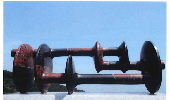
2018 Cina . South Asia Southeast Asia International Art Exhibiton Kunming China