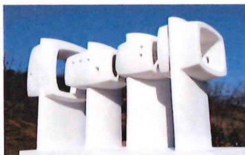
2021 China Wuhu Sculpture Competition Excellence Award