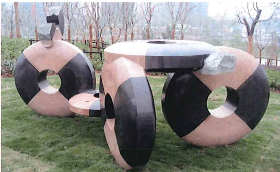
2012 Second Wuhu "Liu Kaiqu Award" China (Silber prize award)