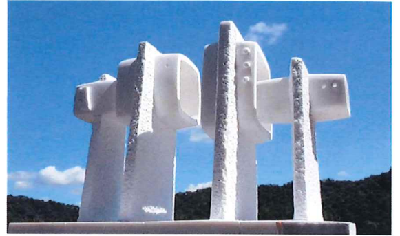
2022 Home of Southern Confucianism, Global call for public Art project in Quzhou China Second Prize award