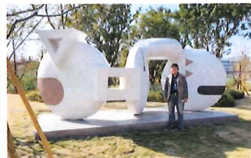
2023 "Chinese pose-Co prosperity and Co-creation" The Wenzhou Sculpture Exhibition Contribution invited 2nd prize award