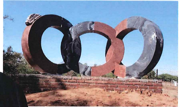
2019 U'TARAYAN International Sculpture Symposium in India