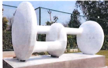
2020 2nd International stone Sculpture Camp (India Ambala)