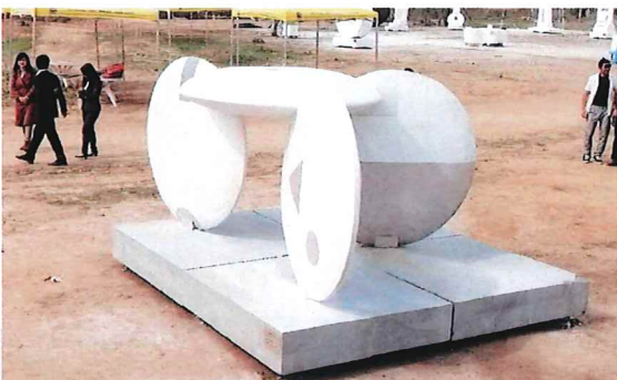
2018 China Tongchuan "Xuan Zang Road" International Sculpture Symposium