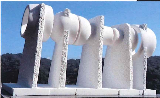
2022 Beijing Winter Olympic Public Sculpture