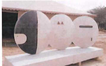
2019 1st Riyadh International Sculpture Symposium Saudi Arabia