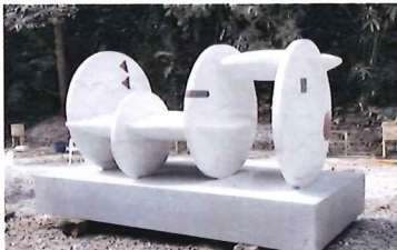
2019 BenQ International Sculpture Symposium in Taiwan