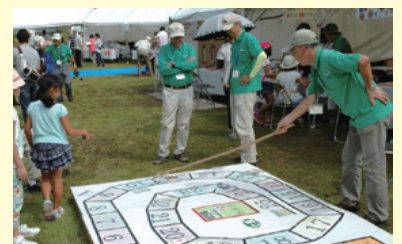
イベントで子供たちとふれあう