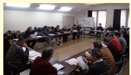
飛鳥里山クラブの方針を決める会議