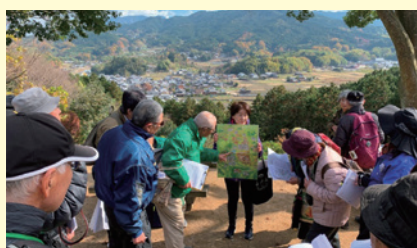
飛鳥の史跡を案内