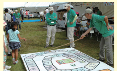
イベントで子供たちとふれあう