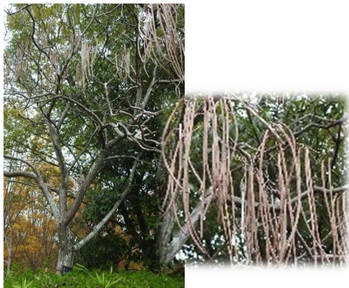
キササゲ(ノウゼンカヅラ科 落葉広葉樹) 実