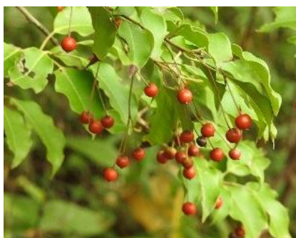
ソヨゴ(モチノキ科) 葉と実