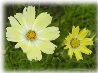
コスモス(キク科 イエローキャンパス)