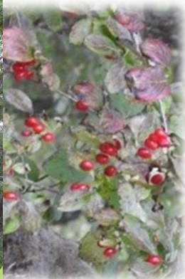
サンシュユ(ミズキ科 落葉小高木) 葉と実