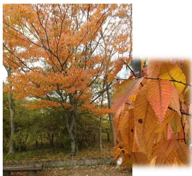
ケヤキ(ニレ科 落葉高木) 紅葉