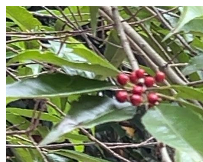
ナナミノキ(モチノキ科)葉と実

まだまだここに載せたい木がたくさんあるのですがそれはまたの機会に。今日は美しい紅葉の中、サークルの皆さんとおしゃべりを楽しみながらの散策、森林浴もできて楽しい一日でした。