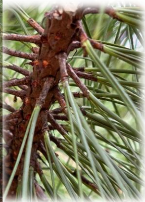
ダイオウショウ(マツ科 葉は3本ずつ束生)