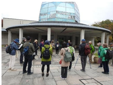
馬見丘陵公園の公園館(中央口)

馬見丘陵公園の美しく整備された園路を回り樹木を中心にいろいろな植物を観察しながら、森林浴を楽しみました。