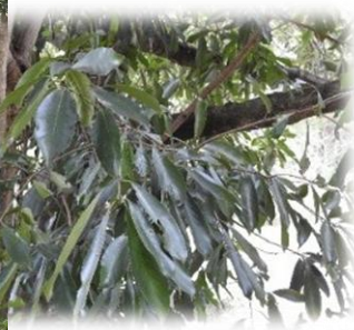
マテバシイ(ブナ科 常緑高木) 葉