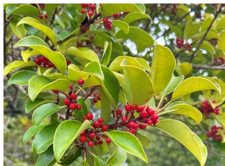
クロガネモチ(クロガネモチ科)