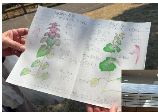
ホトケノザとヒメオドリコソウについて説明