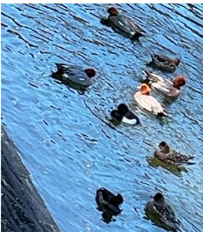
ヒドリガモ・コガモ・マガモ ・キンクロハジロ、遠くにカイツブリ も見えていました。