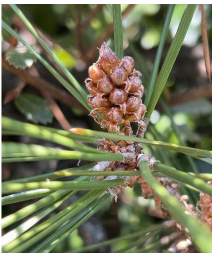
クロマツ (マツ科 雄花 と 雌花 雌雄異花) 開花は4~5月ごろ