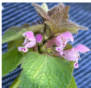
ヒメオドリコソウ(シソ科 葉がスパード型 頂部が赤紫色に染まる 花は下向き)