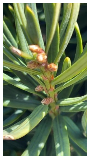
イヌマキ(マキ科 雌雄異株 雄花) 開花は4~6月ごろ

早春らしいぽかぽかと温かい日差しを浴びて散歩することができて、ほっこりした一日でした。