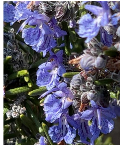
ローズマリー(シソ科)