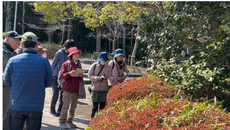
マメグンバイナズナ説明 ツバキの説明中