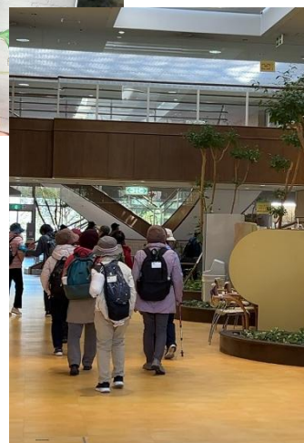
葛城市福祉総合ステーション