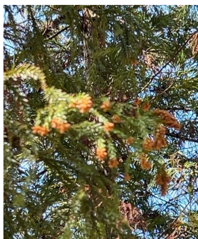
スギ(ヒノキ科) いままさに開花中でした。