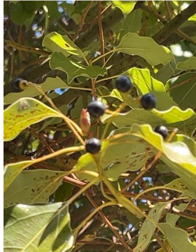
クスノキ(クスノキ科)