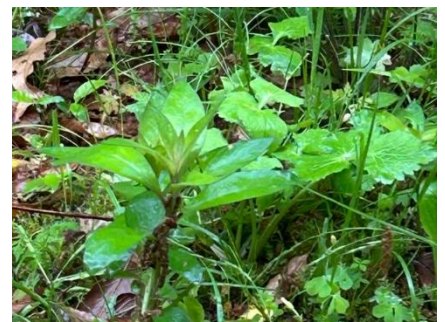
オカトラノオ(サクラソウ科)