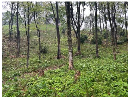
ウバユリ(ユリ科)の群生