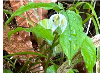
チゴユリ(イヌサフラン科)