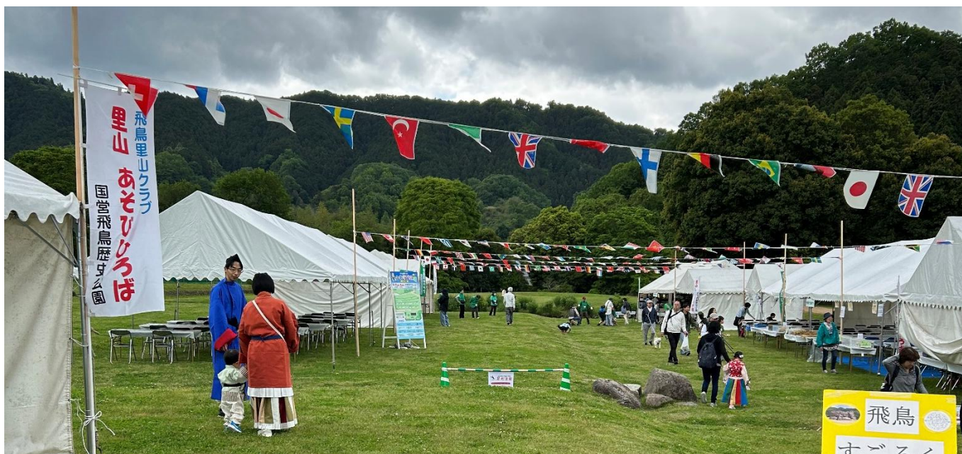
石舞台古墳芝生広場

「葉っぱで遊ぼう」をテーマにしてあそび広場に参加しました。朝、いろいろな葉っぱの準備と道端に生えているいつも見かける野草の準備をして「何人来てくれるかな」と待っていました。