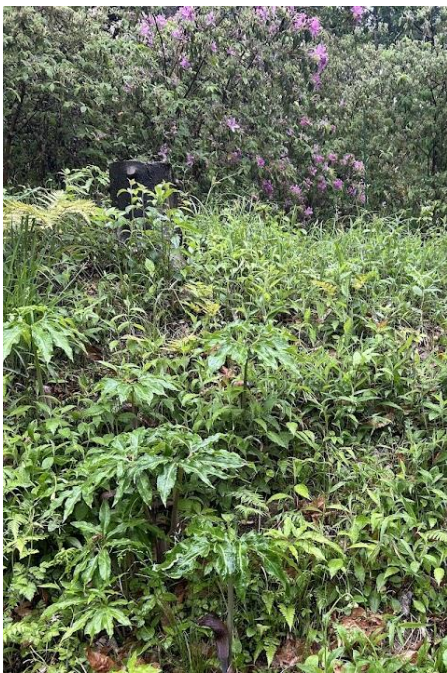
モチツツジ(ツツジ科)と ウラシマソウ(サトイモ科)