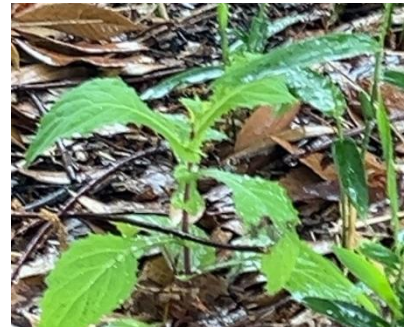
ヤクシソウ(キク科)