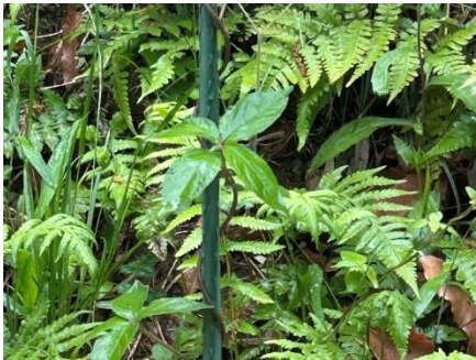
ツルニンジン(キキョウ科)