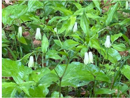
ホウチャクソウ(イヌサフラン科)