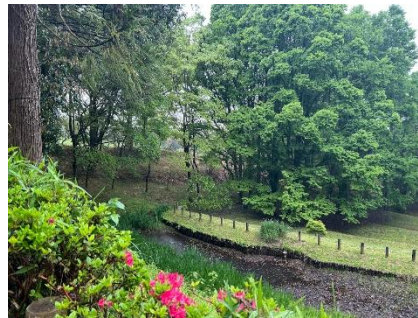
シュレーゲルアオガエルと カツラ(カツラ科)