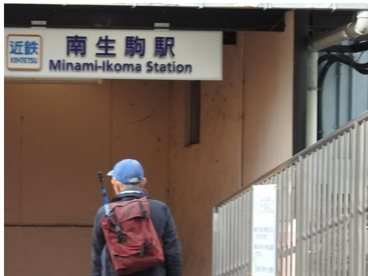
南生駒駅に無事ゴール（諸打ち合わせ後解散）