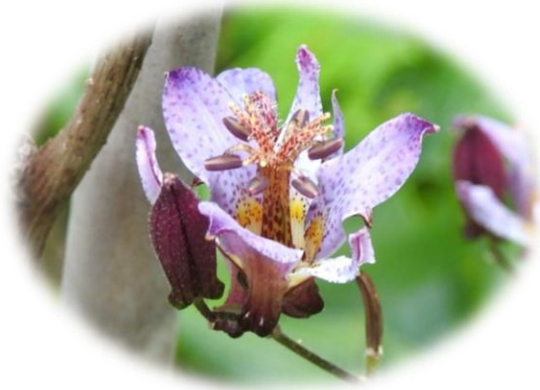
竹林寺境内のホトギス